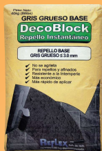
Una bolsa de DecoBlock de 40 kgs

Usando un recipiente limpio, mezcle aproximadamente 2 a 2.5 galones de agua limpia por cada bolsa de 40 kgs (88 lbs) de DecoBlock. Asegurese que la mezcla sea homogénea y libre de grumos. Aplique el DecoBlock a más tardar una hora después de haber sido mezclado con el agua.