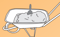
Mezcla preparada para repellos

Para la instalación se recomienda aplicar dos capas: